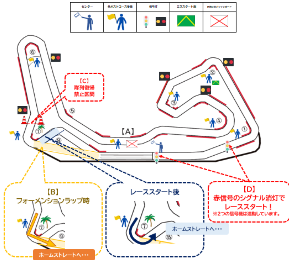
【図2】レーススタート時の各ライン